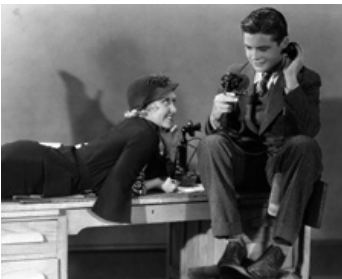
1932 THE FAMOUS FERGUSON CASE de Lloyd Bacon avec Tom Brown