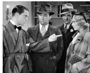
1933 BLONDIE JOHNSON de Ray Enright avec Chester Morris