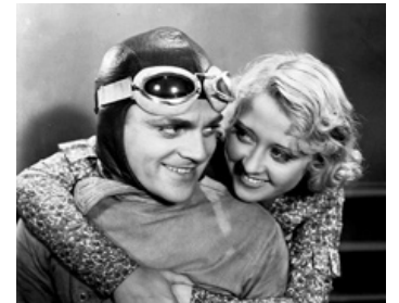
1932 LA FOULE HURLE (The Crowd roars) de Howard Hawks avec James Cagney