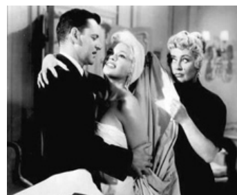
1957 LA BLONDE EXPLOSIVE (Will Success Spoil Rock Hunter?) de F. Tashlin avec R. Randall, J. Mansfield