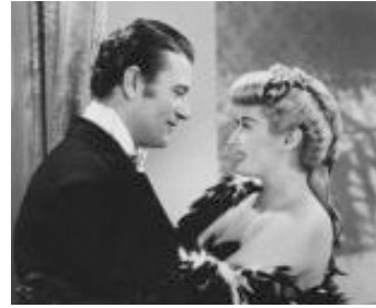
1942 LADY FOR A NIGHT de Leigh Jason avec John Wayne