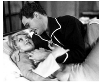
1931 L'ENNEMI PUBLIC (The Public Enemy) de William Wellman avec Edward Woods