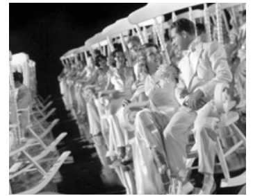
1936 EN PARADE (Gold Diggers of 1937) de Lloyd Bacon avec Dick Powell