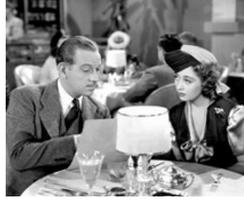
1939 L'ÉTONNANT M. WILLIAMS (The Amazing Mr Williams) d'A. Hall avec Melvyn Douglas