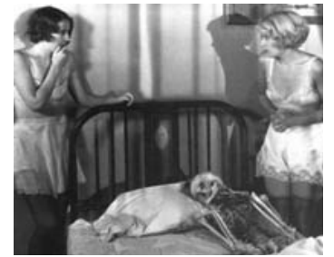
1931 L'ANGE BLANC (Night Nurse) de William Wellman avec Barbara Stanwyck