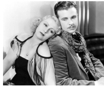
1936 EN SCÈNE (Stage Stuck) de Busby Berkeley avec Dick Powell