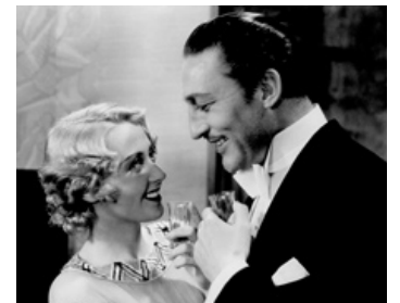
1933 CHERCHEUSES D'OR (Gold Diggers of 1933) de Mervyn Le Roy avec Warren William