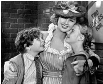
1945 LE LYS DE BROOKLYN (A tree grows in Brooklyn) d'Elia Kazan avec Peggy Ann Garner