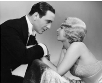
1932 MYSTÉRIEUX WEEK-END (Broadway Bad) de Sidney Lanfield avec Ricardo Cortez