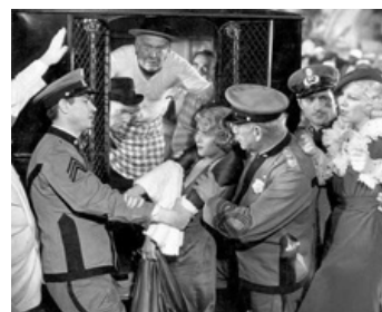
1933 HAVANA WIDOWS de Ray Enright avec Glenda Farrell