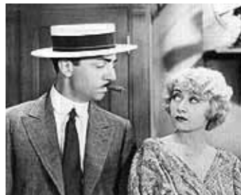
1933 L'AVOCAT (The Lawyer Man) de William Dieterle avec William Powell