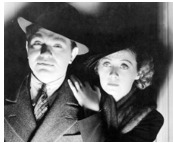
1936 GUERRE AU CRIME (Bullets or Ballots) de William Keighley avec Edward G. Robinson