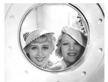
1934 KANSAS CITY PRINCESS de William Keighley avec Glenda Farrell