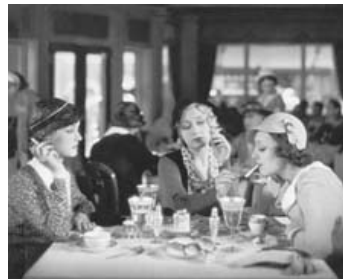
1932 UNE ALLUMETTE POUR TROIS (Three for a Match) de M. LeRoy avec B. Davis, A. Dvorak