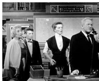
1957 UNE FEMME DE TÊTE (The Desk Set) de Walter Lang avec K. Hepburn, Spencer Tracy