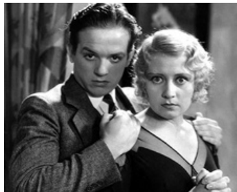
1932 BIG CITY BLUES de Mervyn Le Roy avec Eric Linden