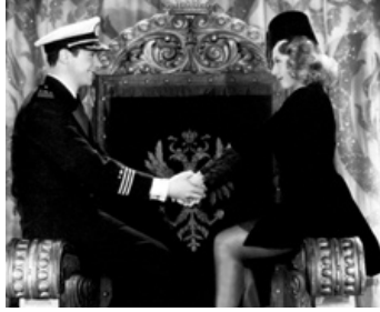
1937 LE ROI ET LA FIGURANTE (The King and the Chorus Girl) de M. Le Roy avec Fernand Gravy