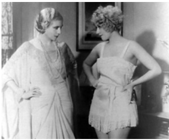
1931 MILLIE (Millie) de John F. Dillon avec Lilyan Tashman