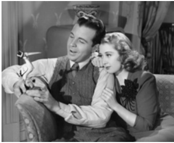
1941 MONSIEUR JOE (Model Wife) de Leigh Jason avec Dick Powell