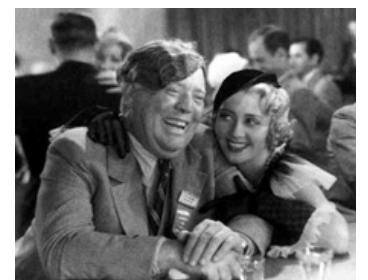
1933 CONVENTION CITY d' Archie Mayo avec Guy Kibbee