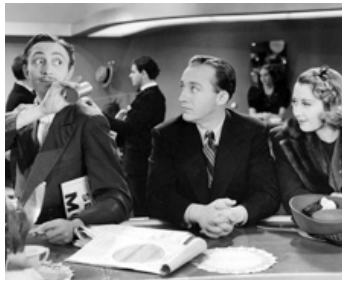
1939 EAST SIDE OF HEAVEN de David Butler avec Mischa Auer, Bing Crosby