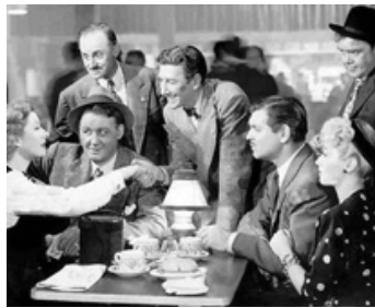
1945 L'AVENTURE (Adventure) de Victor Fleming avec Greer Garson, Clark Gable, Th. Mitchell