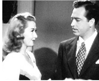
1941 THREE GIRLS ABOUT TOWN de Leigh Jason avec Binnie Barnes