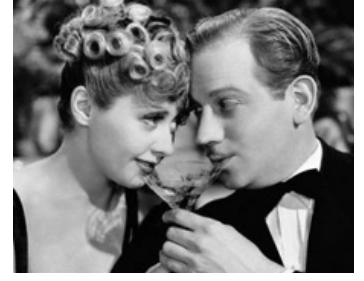
1938 MISS CATASTROPHE (There's Always a Woman) d'Alexander Hall avec Melvyn Douglas