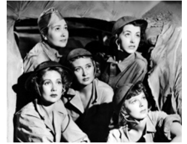
1943 CRY HAVOC de Richard Thorpe avec Marsha Hunt, Ann Sothern, Fay Bainter, M. Sullivan