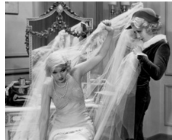
1932 THE GREEKS HAD A WORD FOR THEM de Lowell Sherman avec Ina Claire