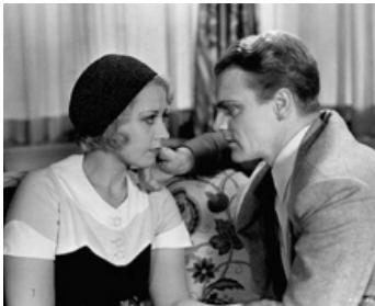
1931 BLONDE CRAZY (Blonde Crazy) de Roy Del Ruth avec James Cagney