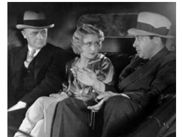
1932 NUIT D'AVENTURES (Central Park) de John Adolphi avec Wallace Ford