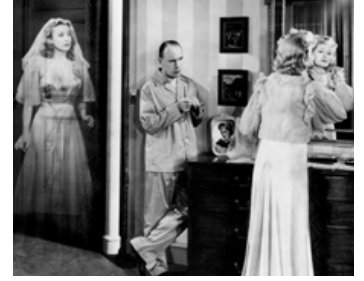
1941 LE RETOUR DE TOPPER (Topper Returns) de Roy Del Ruth avec Billie Burke, Roland Young