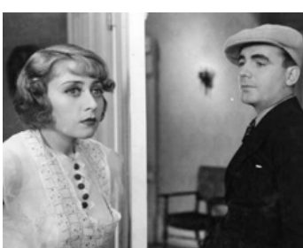
1934 I'VE GOT YOUR NUMBER de Ray Enright avec Pat O'Brien