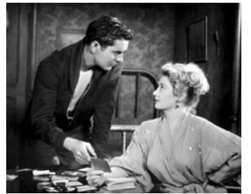
1947 LE CHARLATAN (Nightmare Alley) d'Edmund Goulding avec Tyrone Power