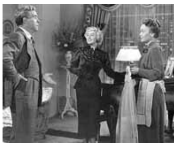
1951 LA FEMME AU VOILE BLEU (The Blue Veil) de Curtis Bernhardt avec Jane Wyman