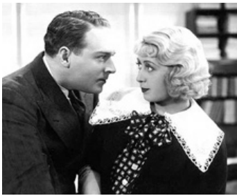
1935 BROADWAY GONDOLIER de Lloyd Bacon avec George Barbier