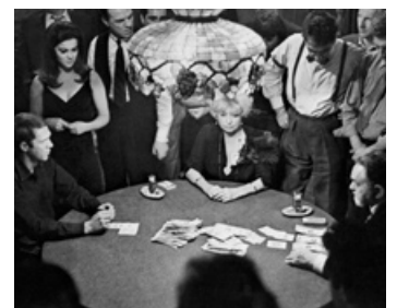
1965 LE KID DE CINCINNATI (The Cincinnati Kid) de N. Jewison avec S. McQueen, E. G. Robinson