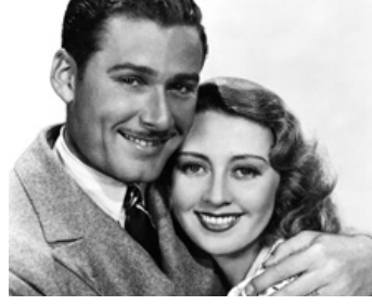
1937 UN HOMME A DISPARU (The Perfect Specimen) de Michael Curtiz avec Errol Flynn