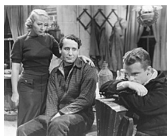
1934 HE WAS HER MAN de Lloyd Bacon avec Victor Jory, James Cagney