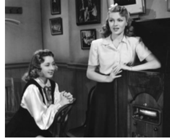
1940 TWO GIRLS ON BROADWAY de Simon S. Simon avec Lana Turner