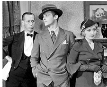
1932 GARE CENTRALE (Union Depot) d' Alfred E. Green avec Douglas Fairbanks Jr