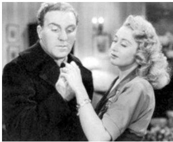
1945 DON JUAN QUILLIGAN (Don Juan Quilligan) de Frank Tuttle avec William Bendix